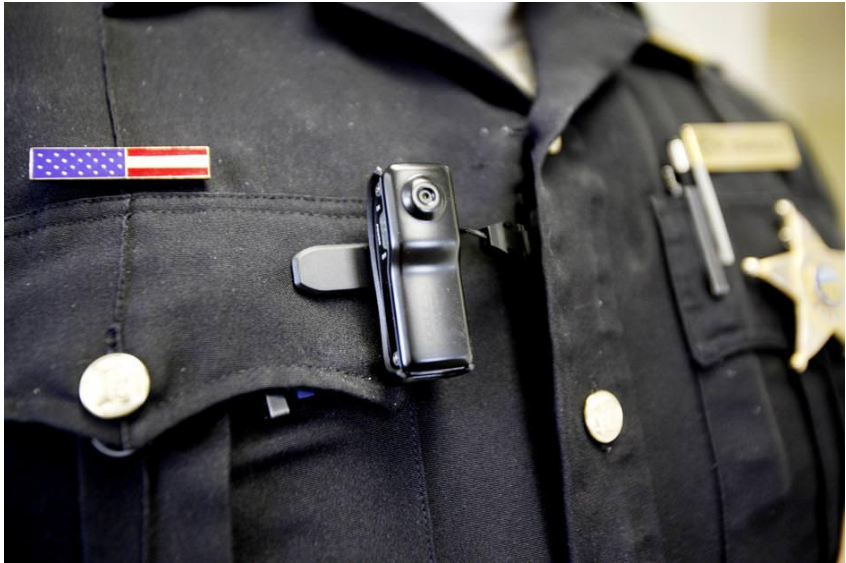
กล้องทุกตัวที่ติดกับเครื่องแบบตำรวจเป็นเพียงอีกหนึ่งเครื่องจักรกลที่ปล่อยให้เราสงบ

เมื่อคืนก่อนฉันยืนอยู่บนชานชาลารถไฟใต้ดินและแหงนมองป้ายดิจิทัลที่ประกาศเวลาการมาถึงของ แต่ ณ ขณะนั้น ป้ายสัญญาณกำลังส่งข้อความที่ต่างออกไป “กล้องวงจรปิดไม่รับประกันว่าจะป้องกัน ช่างรู้สึกทึ่งที่บรรดาสถาบันการติดตั้งกล้องวงจรปิดต่างยอมรับสิ่งนี้ ในขณะที่ผู้คนจำนวนมากที่ได้รับการเฝ้าระวังตรวจตราจากกล้องวงจรปิดนั้นกลับไม่ตระหนักถึงมัน เพราะพวกเขาล้วนให้การสนับสนุนการนำกล้องติดตัวตำรวจมาใช้