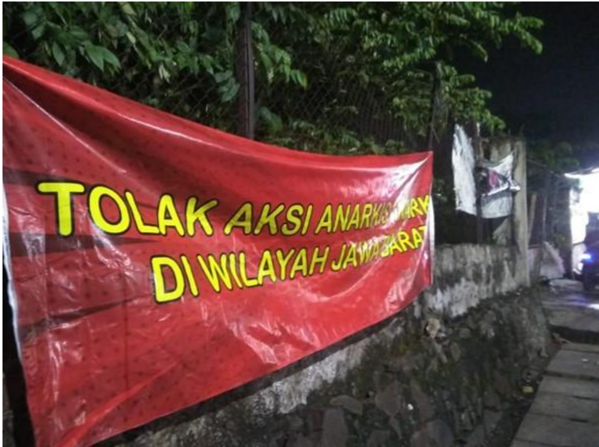
Dari Inti Jaya News.