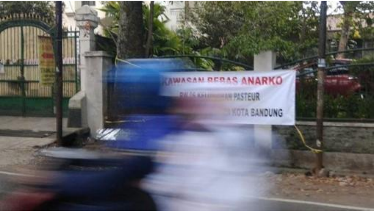
Dari Tribun Jabar/Mega Nugraha.