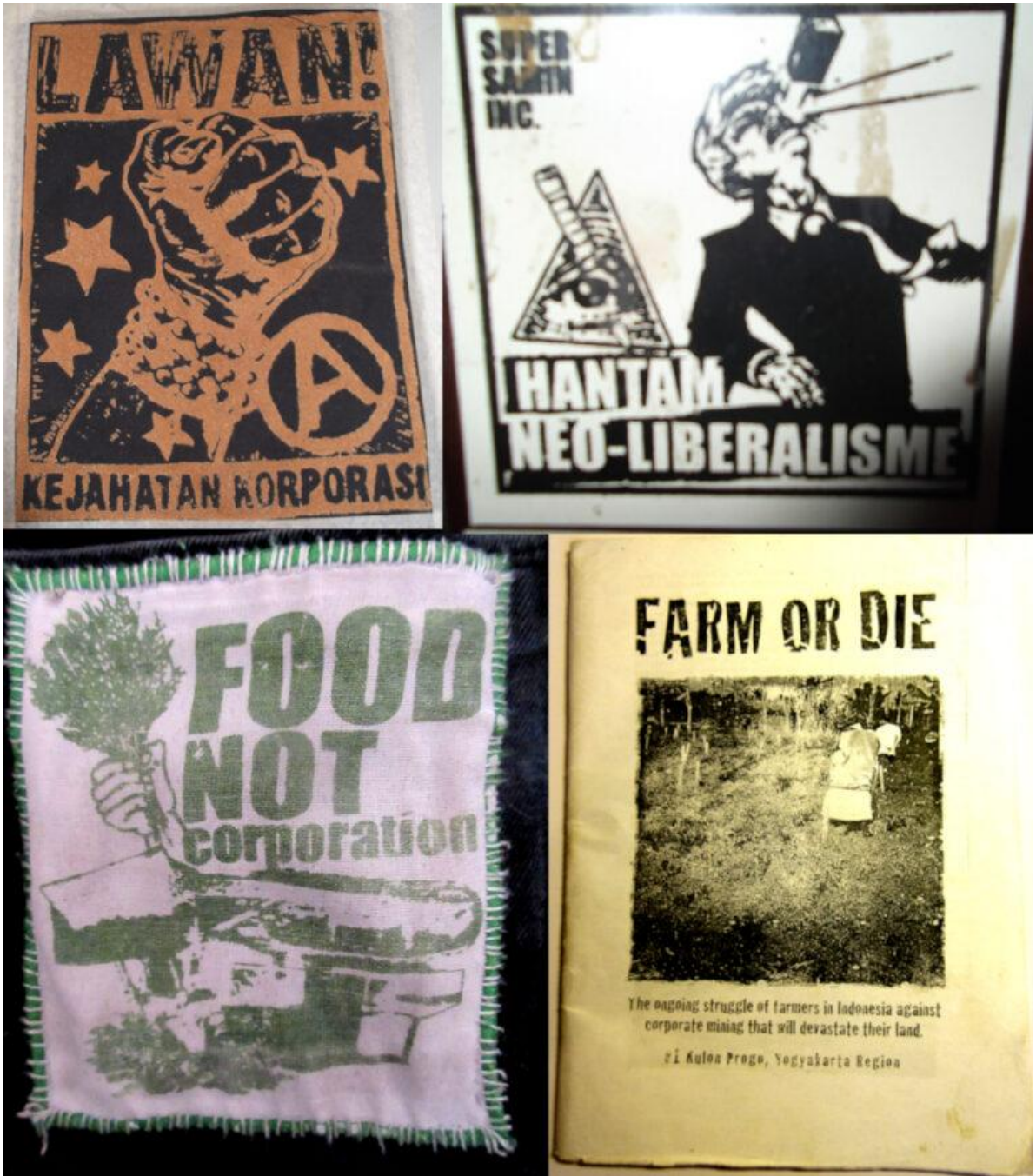
Contoh poster, stiker, patch dan zine yang menentang neoliberalisme dan ekstraktivisme di Indonesia.