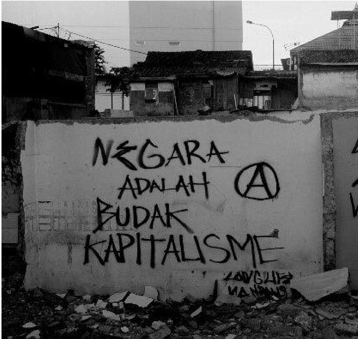
Graffiti pada reruntuhan rumah yang dibongkar di Tamansari, Bandung, c. 2019.