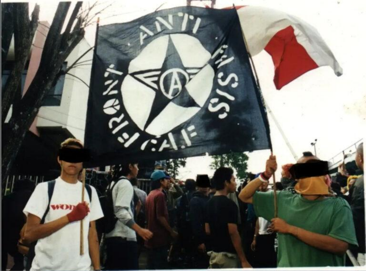
Front Anti Fasis sekitar tahun 1998.