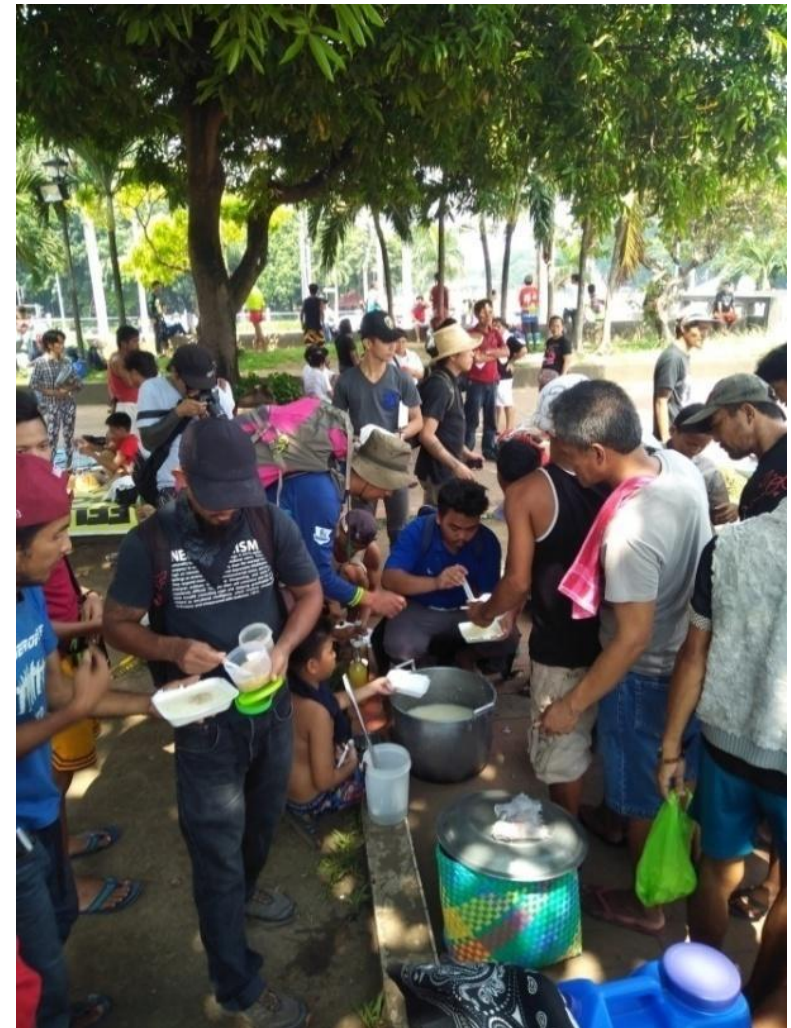
Figure 22. Food Not Bombs sa Ang Pekeng Balita ay Karahasan sa Luneta Park, Manila, September 21, 2017