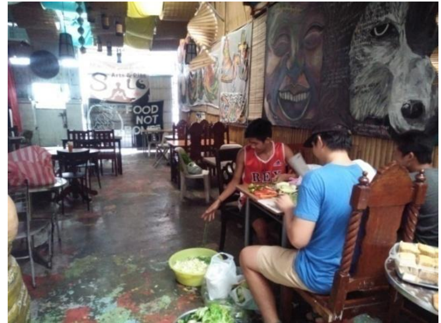
Figure 24. Paghahanda ng mga mga nakolektang gulay mula sa palengke sa Mandaluyong, July 16, 2017