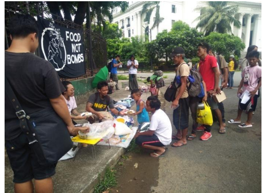
Figure 16. Food Not Bombs at Free Market sa Solidarity Against War , Luneta Park, Manila, July 16, 2017