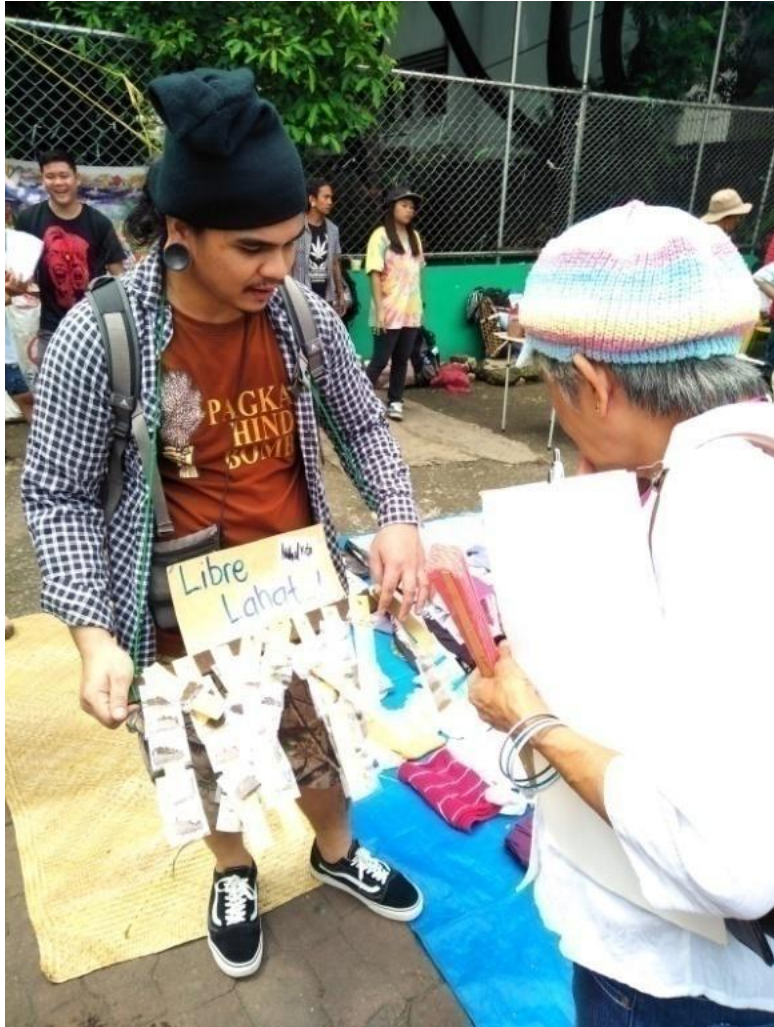
Figure 13. FNB volunteer na namamahagi ng mga buto ng gulay