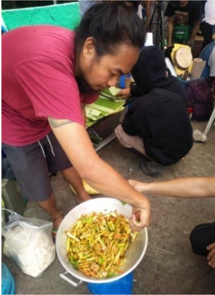
Figure 4. Pagluluto ng ipapamahaging pagkain sa Sining Kalikasan Aklasan 2017