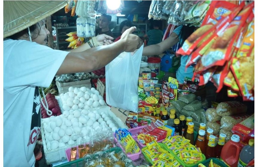
Figure 3. Pangongolekta ng mga sangkap mula sa palengke (1)