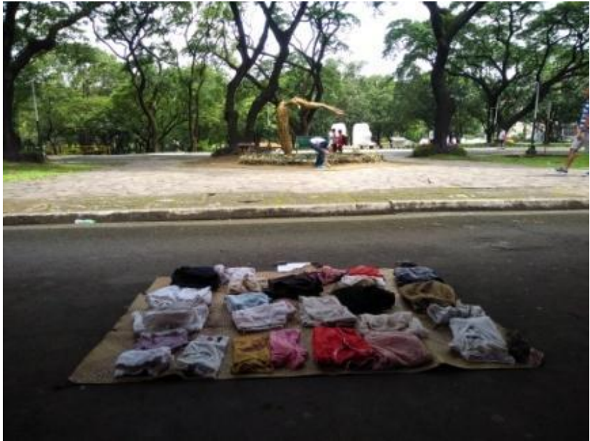
Figure 6. Halimbawa ng Free Market