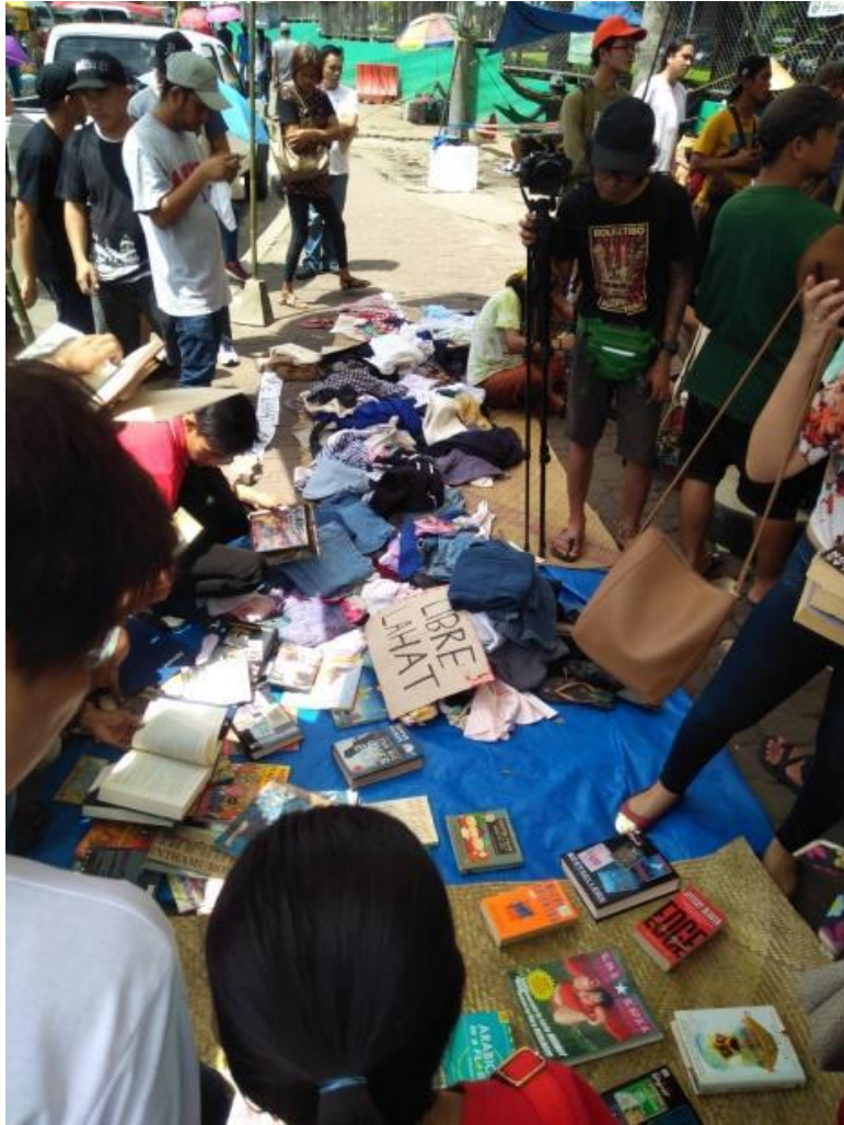
Figure 23. Isa pang halimbawa ng Free Market, SKA 2017

ang mga pag-aresto. Dahil dito, mas umani ng pagkilala ang Food Not Bombs maging sa ibang bayan. Sinabi ni McHenry,