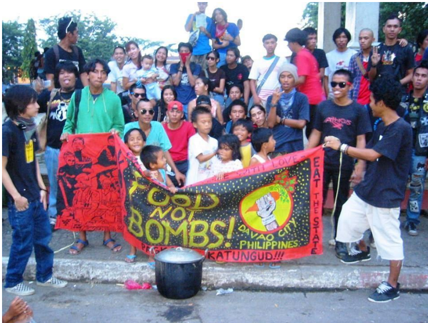
Figure 15. Food Not Bombs- Davao , 2005