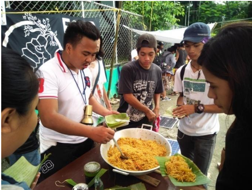
Figure 9. Food Not Bombs sa Sining Kaliksan Aklasan , Quezon City Circle, July 31, 2017