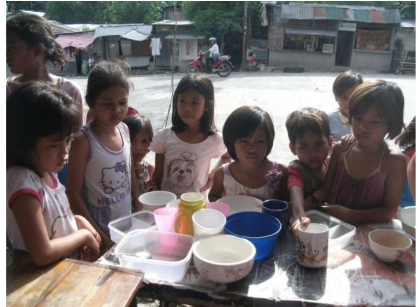
Figure 2. Mga batang naghihintay sa pagkaing ihahain ng FNB