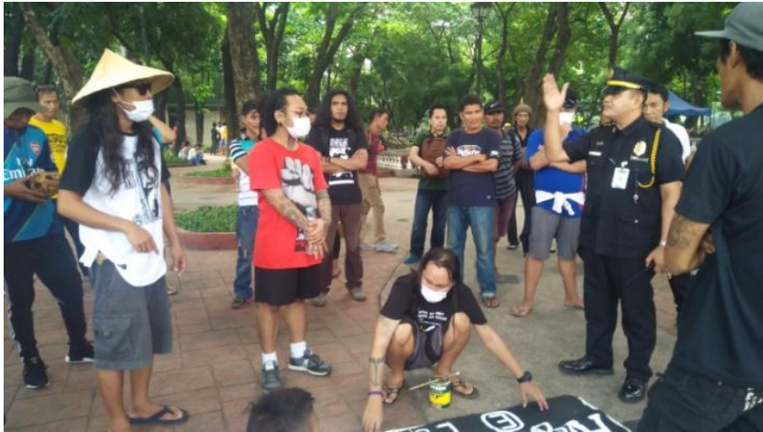
Figure 25. FNB volunteers , kaharap ang hepe sa seguridad ng Luneta Park, Semptember 21, 2017