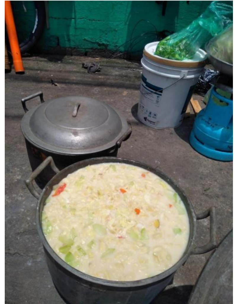
Figure 10. Libreng sopas para sa mga dumadaan sa Sining Kaliksan Aklasan , 2017