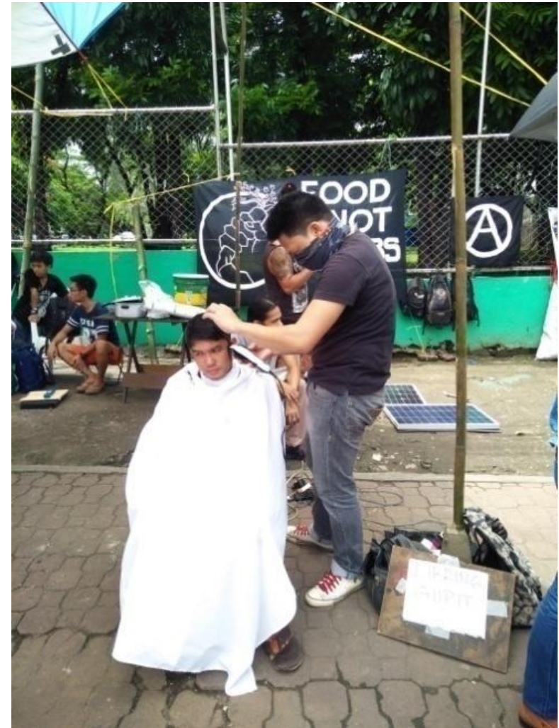
Figure 12. Volunteer ng FNB na nagbibigay din ng libheng gupit

Iba-iba man ang taktika, kahanga-hanga kung paanong ang karamihan sa mga chapters ay nagagawang sundin ang mga batayang pilosopiya ng FNB kahit hindi sila gaanong nakikipag-ugnay sa isa't isa, o kahit walang direktang ugnayan ang mga ito sa mga nagpasimula ng FNB sa ibang bansa. Natutunan lamang nila ito sa mga babasahin at mga kwentuhan. Sa katunayan, kung titignan ang website ng Food Not Bombs (Global) 18 , makikitang hindi lahat ng aktibong Food Not Bombs chapter ay nakalista sa kanilang database .