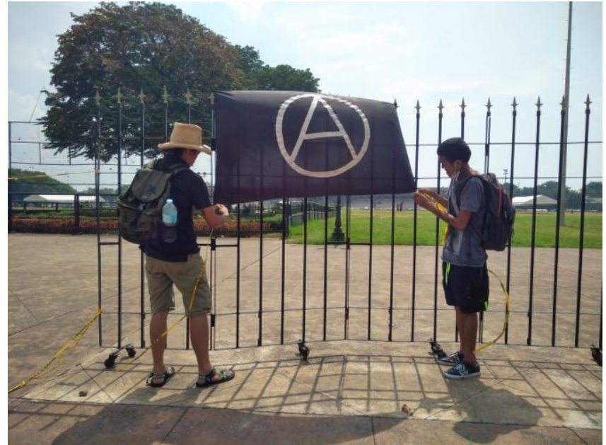
Figure 8. Mga nagpa-FNB na nagkakabit ng bandila ng Anarkismo sa Luneta Park sa Manila, September 21, 2017