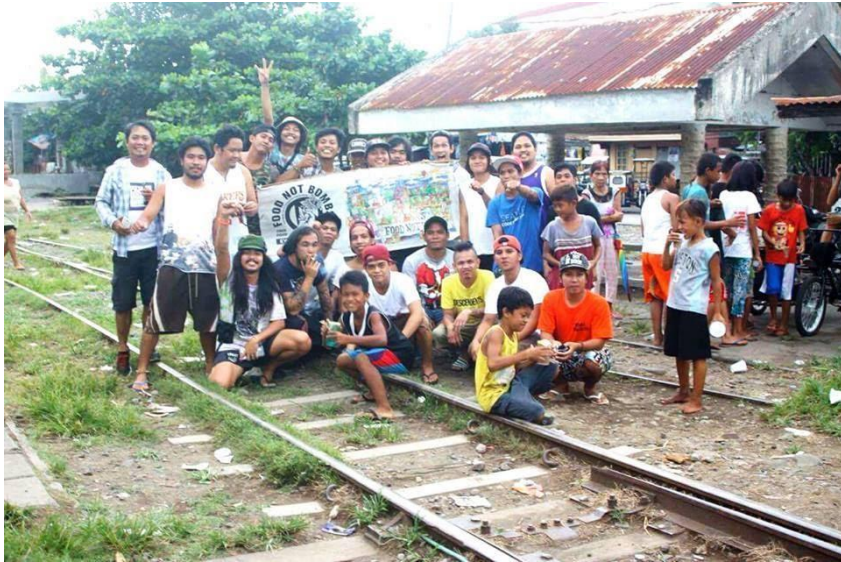
Figure 19. FNB volunteers ng Lucena at Tayabas, Quezon at Dasmaringas, Cavite sa mga riles ng Lucena, September 2016 (4)

Ang paghihikayat sa mga tao na kumunsumo ng maraming produktong karne ay kakikitaan din ng pagmamalabis. Imbes na magtanim ng natural na uri ng mga halaman para sa pagkain ng tao, nagtatayo ng malalaking GMO (Genetically Modified Organism) farms para ipakain ang mga naaani nito sa mga kakataying hayop. Sinasabing sobra pa sa pangangailangan ng lahat ng tao ang mga tanim na ito pero pinipiling ipakain ito sa mga hayop na bibilhin sa mas mataas na presyo. May mga kompanya pa na pang-agrikultura, gaya ng Monsanto na nagpaparehistro ng patent ng mga buto kaya naman nagkakaroon sila ng dahilan para kasuhan ang maliliit na magsasaka na nagtatanim ng mga butong na-kontamina ng butong “inimbento” nila.