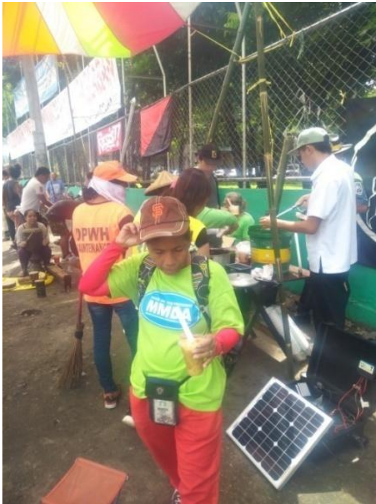
Figure 11. Street Sweeper sa Quezon City ,pagkatapos dumaaan sa mesa ng Food Not Bombs