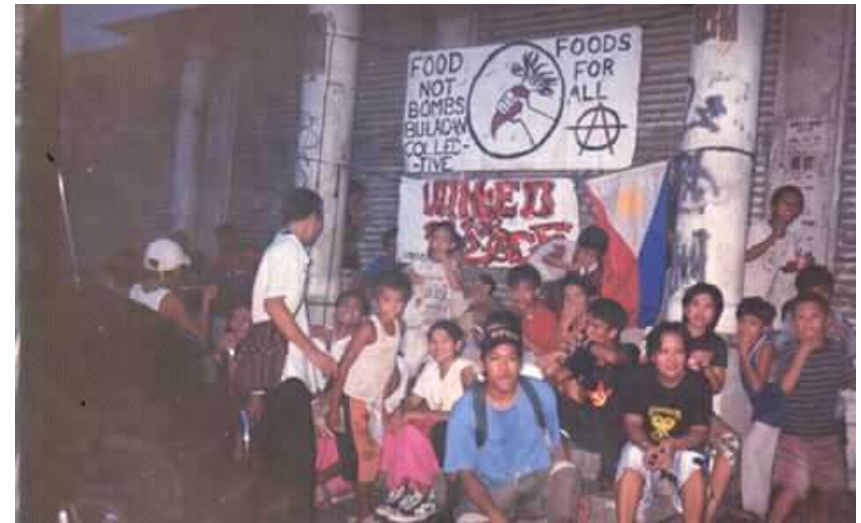
Figure 20. Lumang larawan ng mga FNB volunteers sa Guiguinto Bank sa Sapangpalay, Bulacan (5)