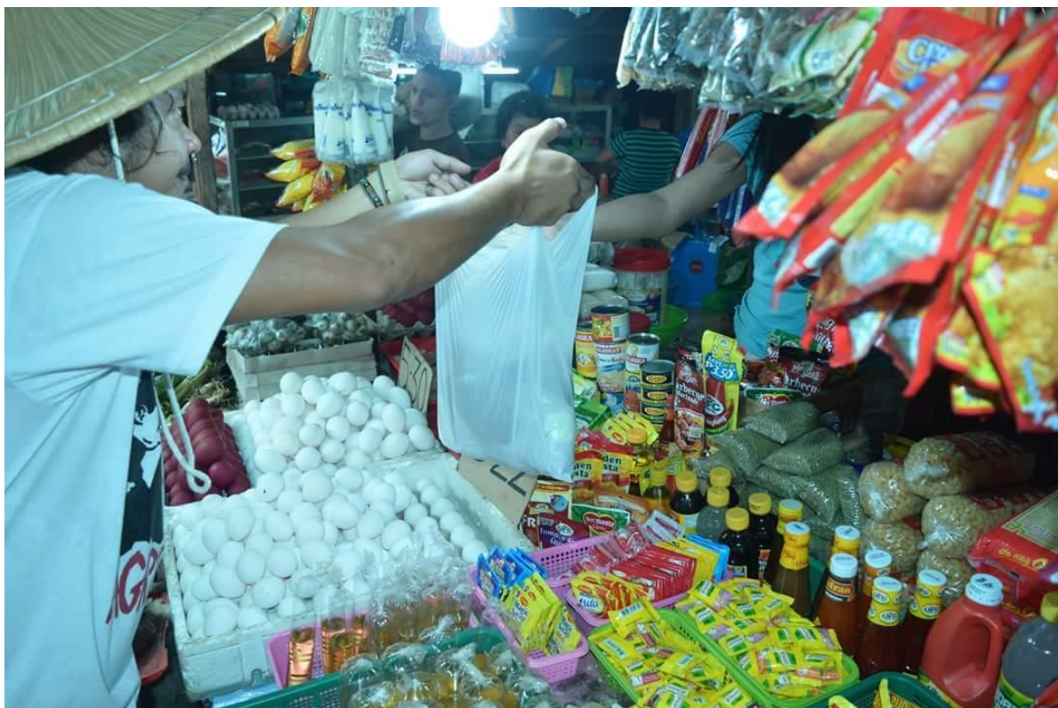
Figure 3. Pangongolekta ng mga sangkap mula sa palengke (1)