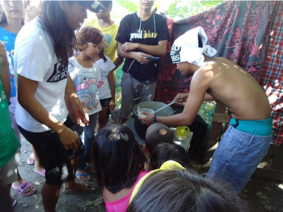
Figure 21. FNB ng Onsite Infoshop sa Muntinlupa, Manila, 2017 (6)