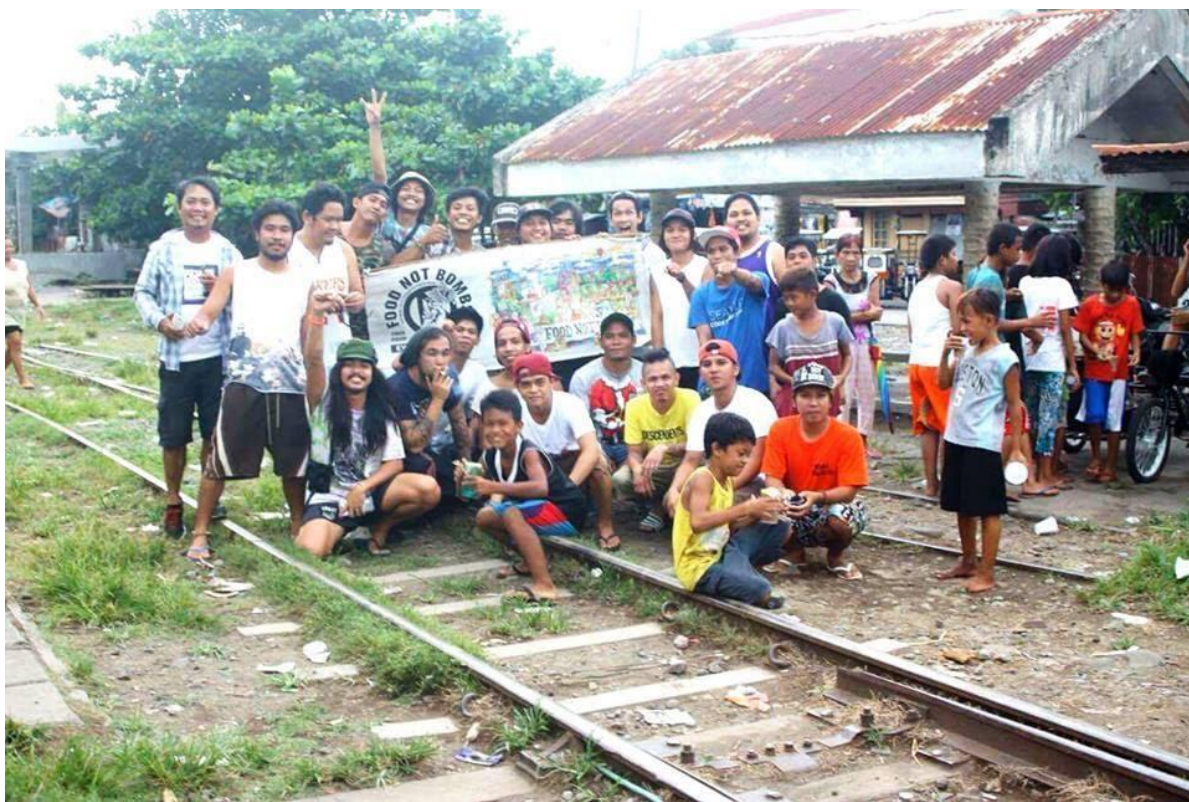
Figure 19. FNB volunteers ng Lucena at Tayabas, Quezon at Dasmaringas, Cavite sa mga riles ng Lucena, September 2016 (4)