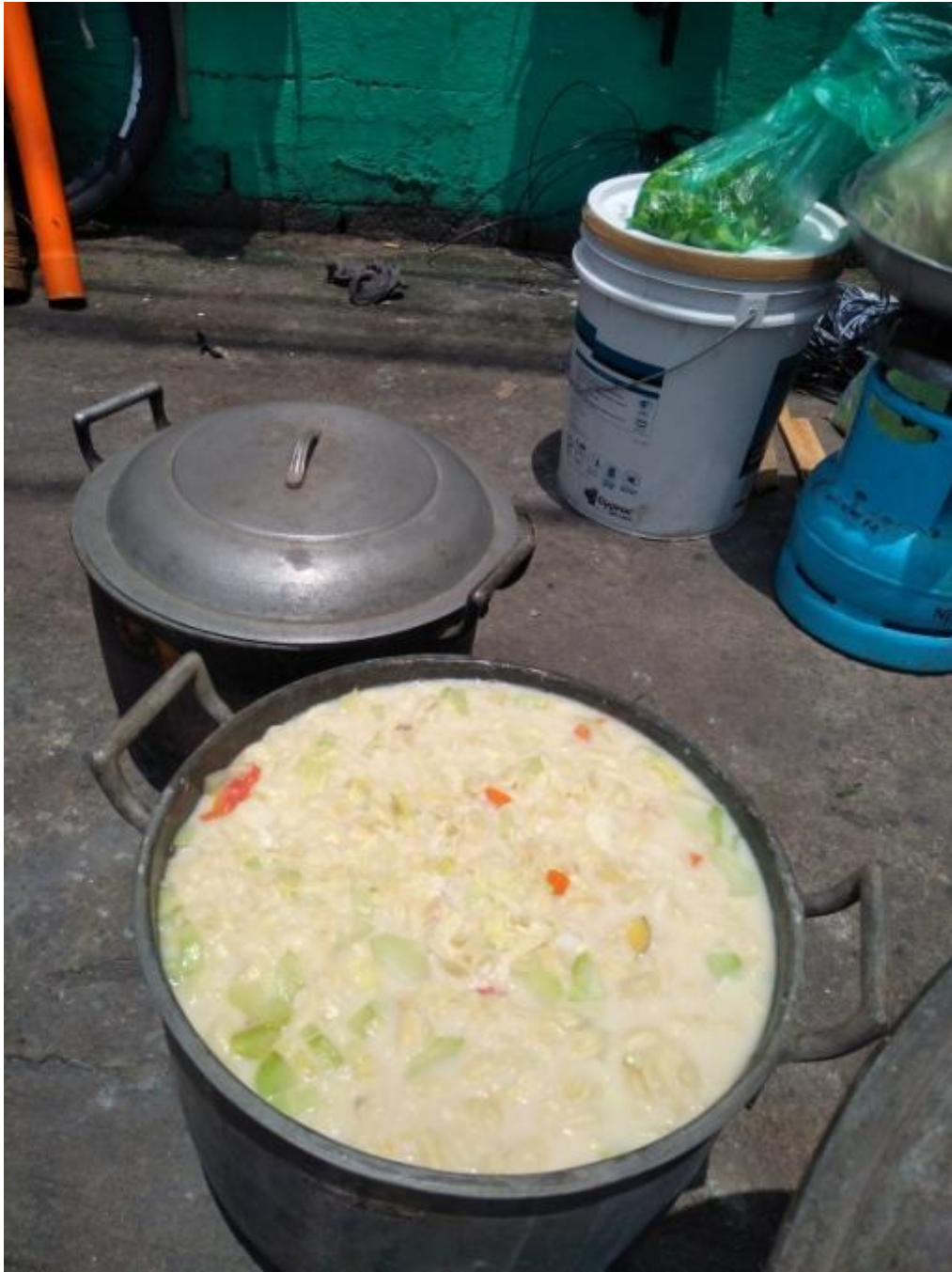
Figure 10. Libreng sopas para sa mga dumadaan sa Sining Kaliksan Aklasan, 2017