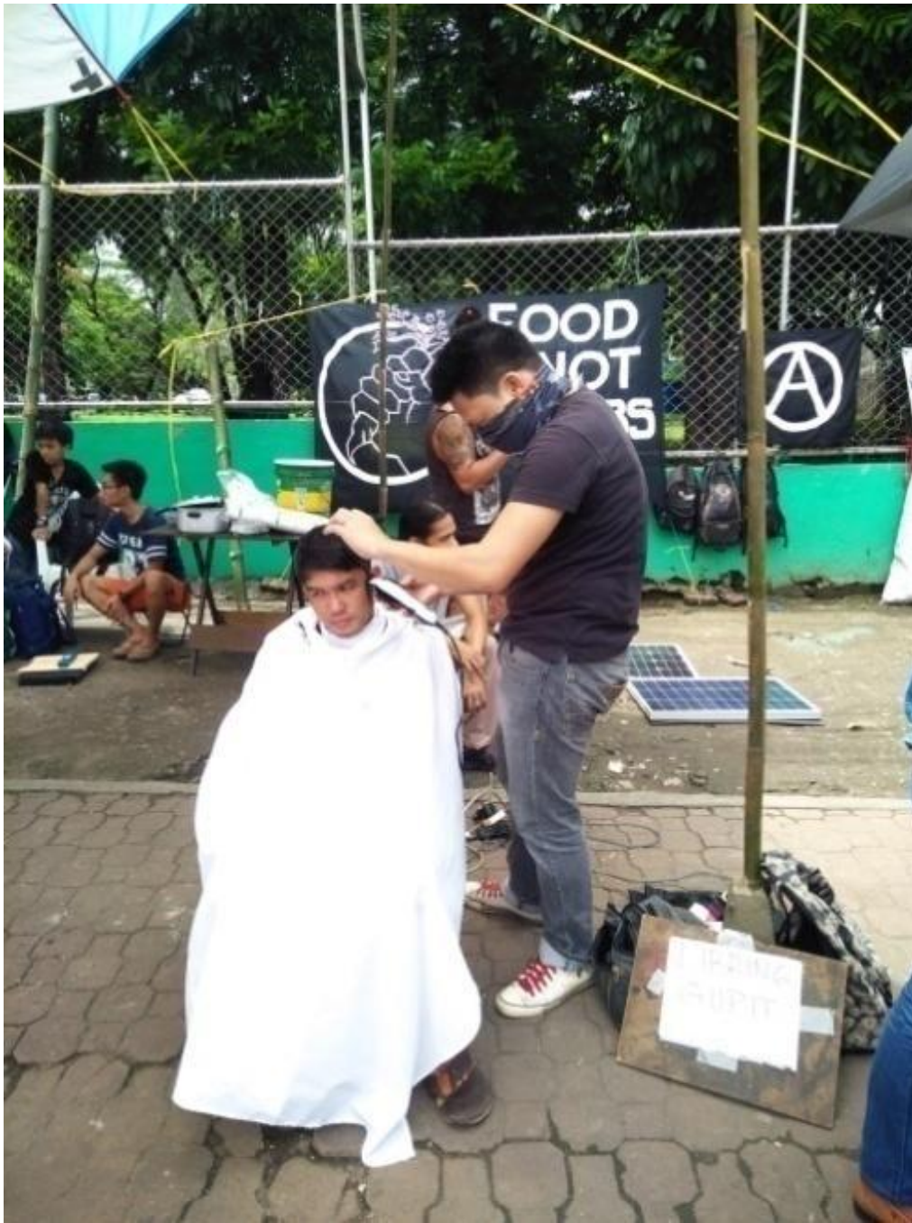
Figure 12. Volunteer ng FNB na nagbibigay din ng libreng gupit