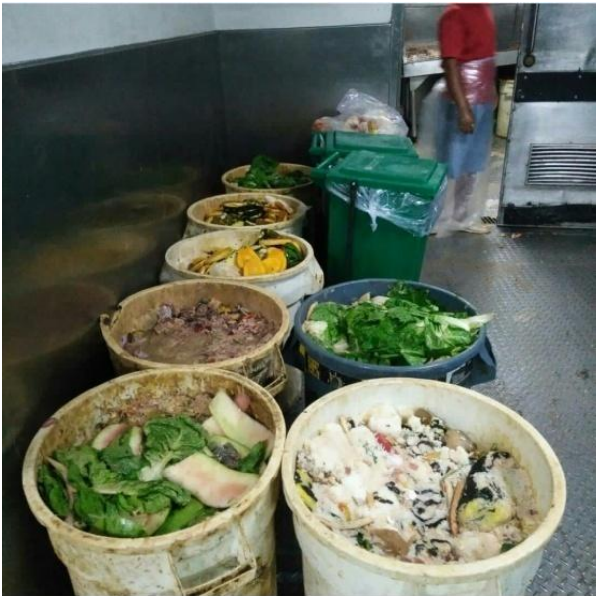
Figure 1. Maliit na bahaging pagkaing hindi nakain sa isang hotel sa Makati