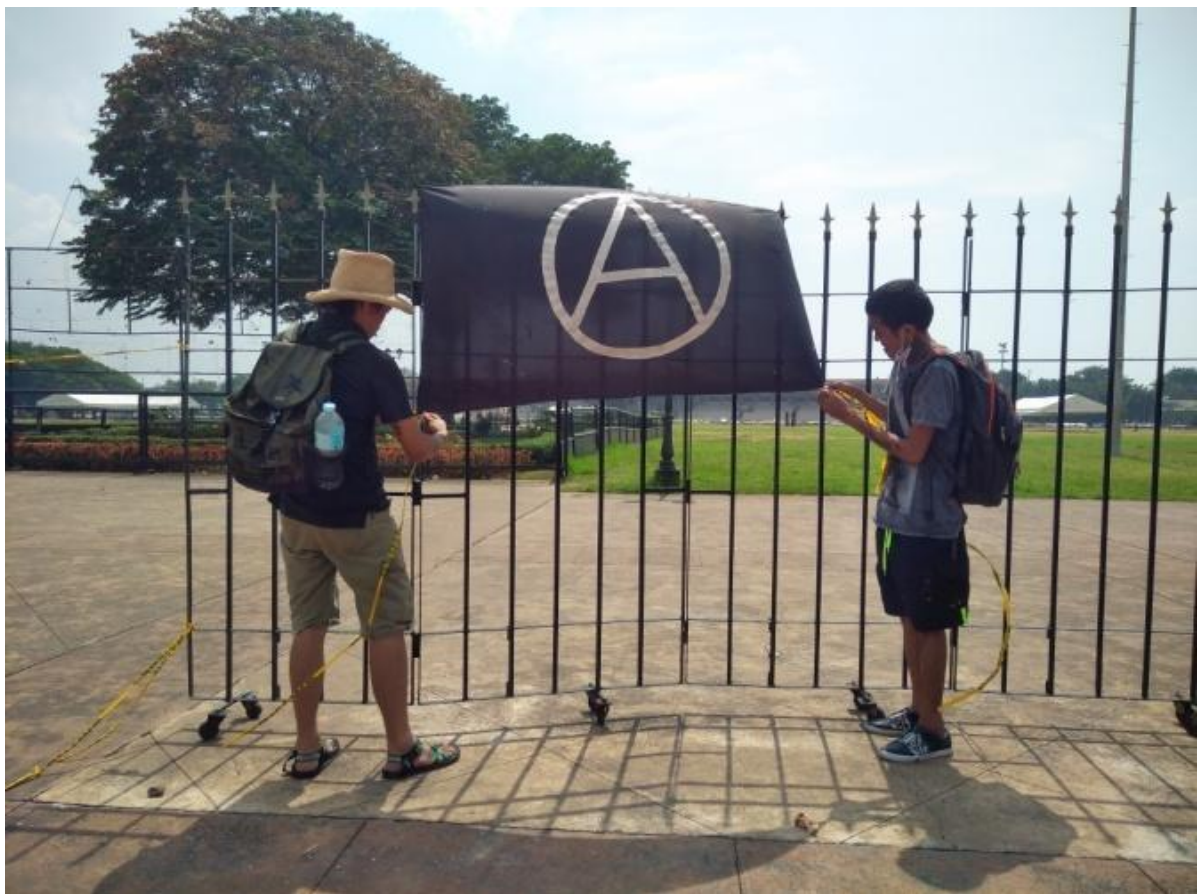
Figure 8. Mga nagpa-FNB na nagkakabit ng bandila ng Anarkismo sa Luneta Park sa Manila, September 21, 2017