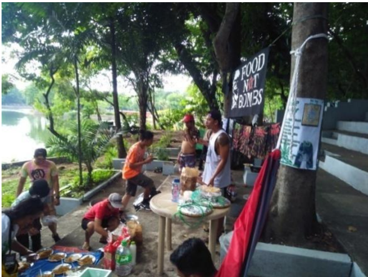
Figure 18. Lucena Food Not Bombs, nagluto para sa Global Marijuana March sa Parks 'n Wildlife, Quezon City, May 7, 2017