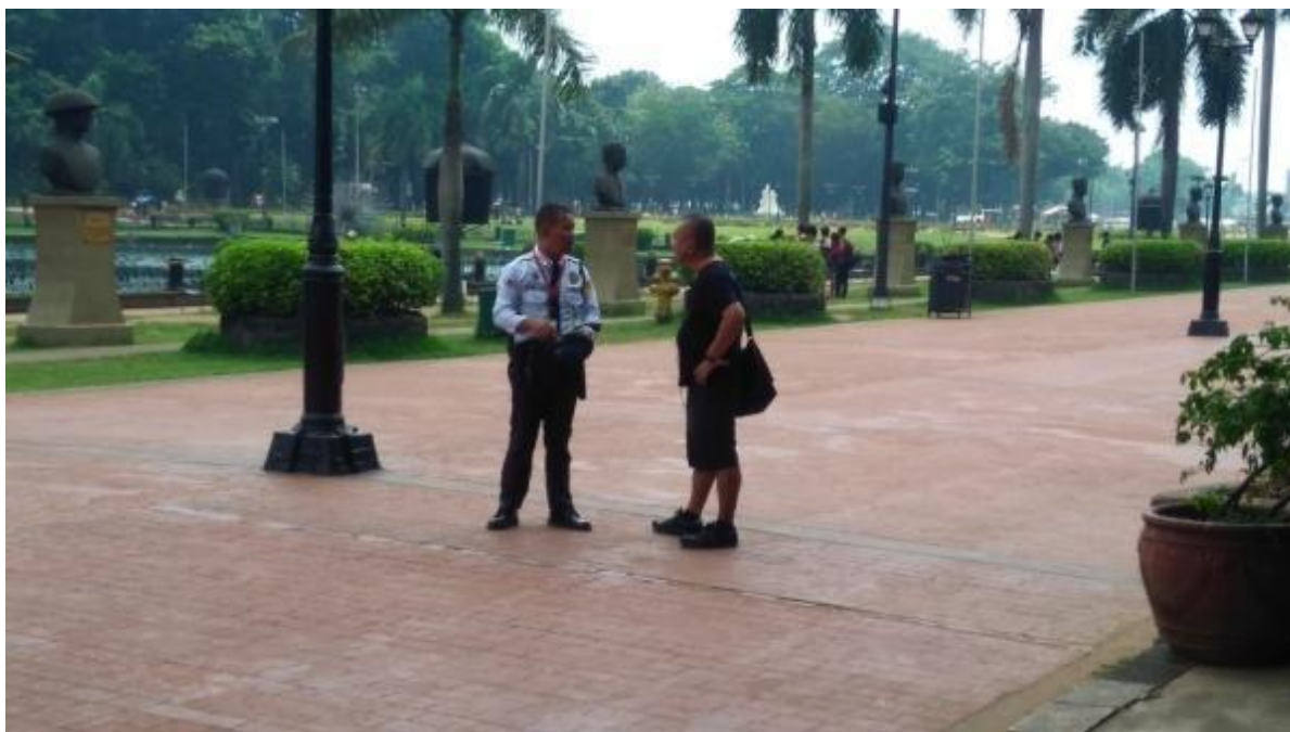
Figure 7. Estrangherong ipinagtatanggol ang FNB sa guwardiya ng Luneta Park, September 21, 2017