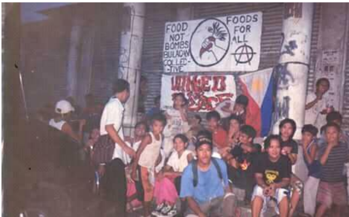
Figure 20. Lumang larawan ng mga FNB volunteers sa Guiguinto Bank sa Sapangpalay, Bulacan (5)