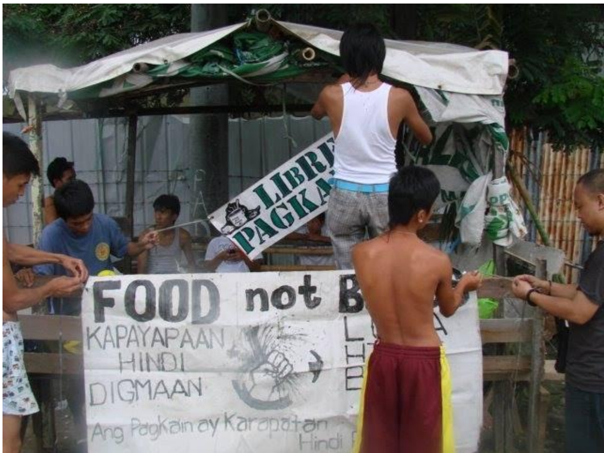
Figure 5. Mga residente na tumutulong sa pag- set-up ng Food Not Bombs sa Muntinlupa (2)