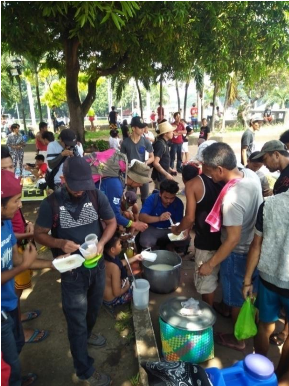
Figure 22. Food Not Bombs sa Ang Pekeng Balita ay Karahasan sa Luneta Park, Manila, September 21, 2017