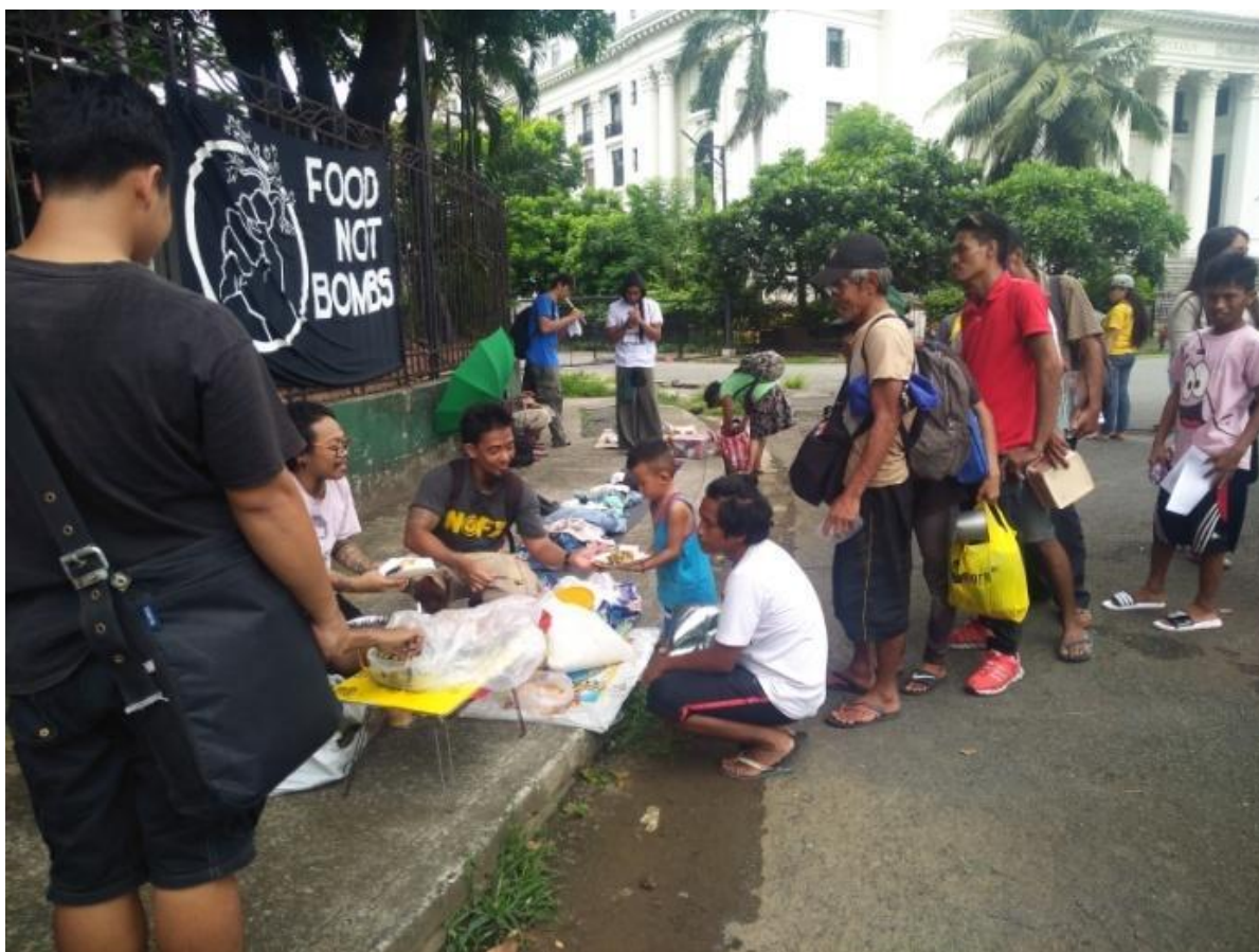
Figure 16. Food Not Bombs at Free Market sa Solidarity Against War , Luneta Park, Manila, July 16, 2017