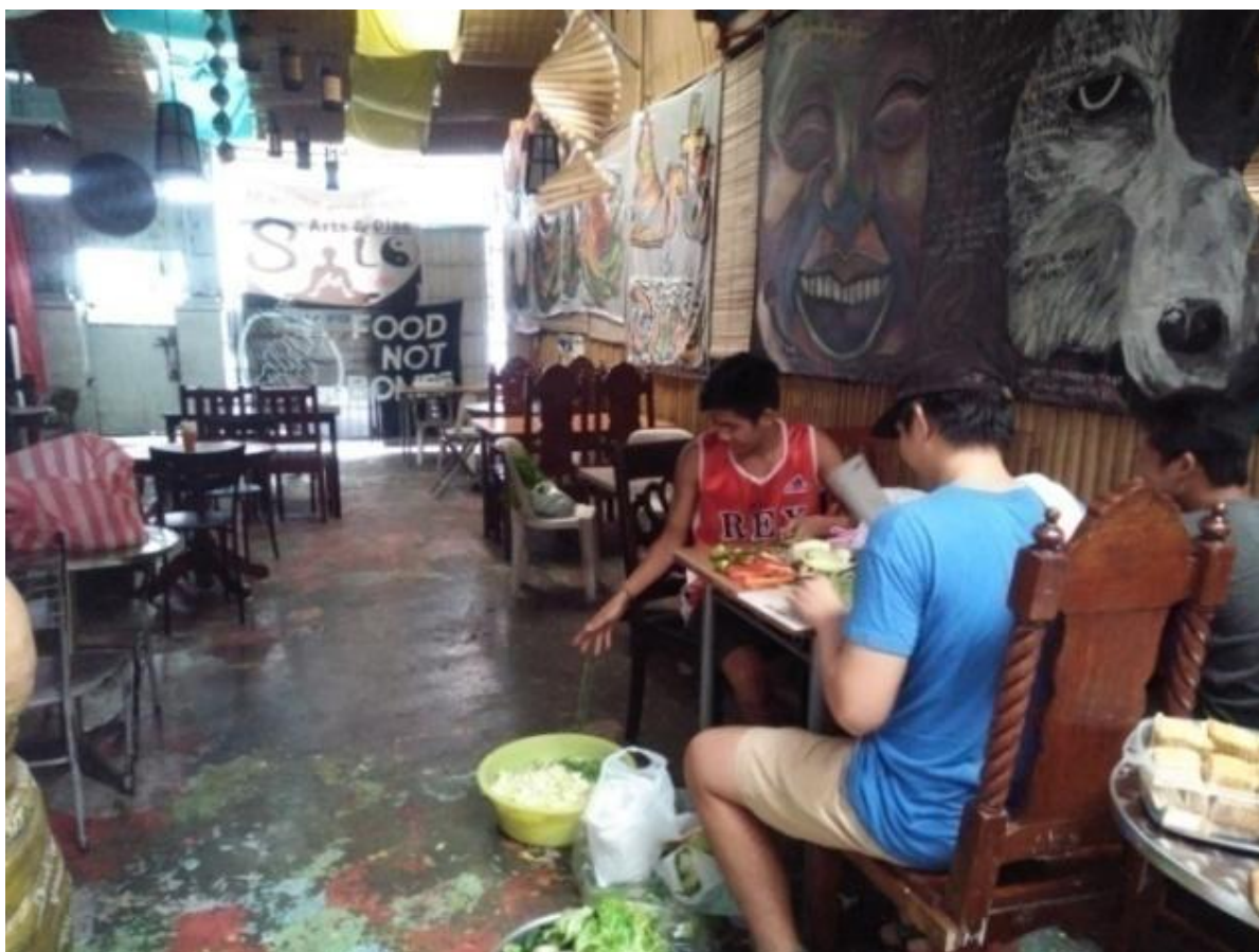
Figure 24. Paghahanda ng mga mga nakolektang gulay mula sa palengke sa Mandaluyong, July 16, 2017